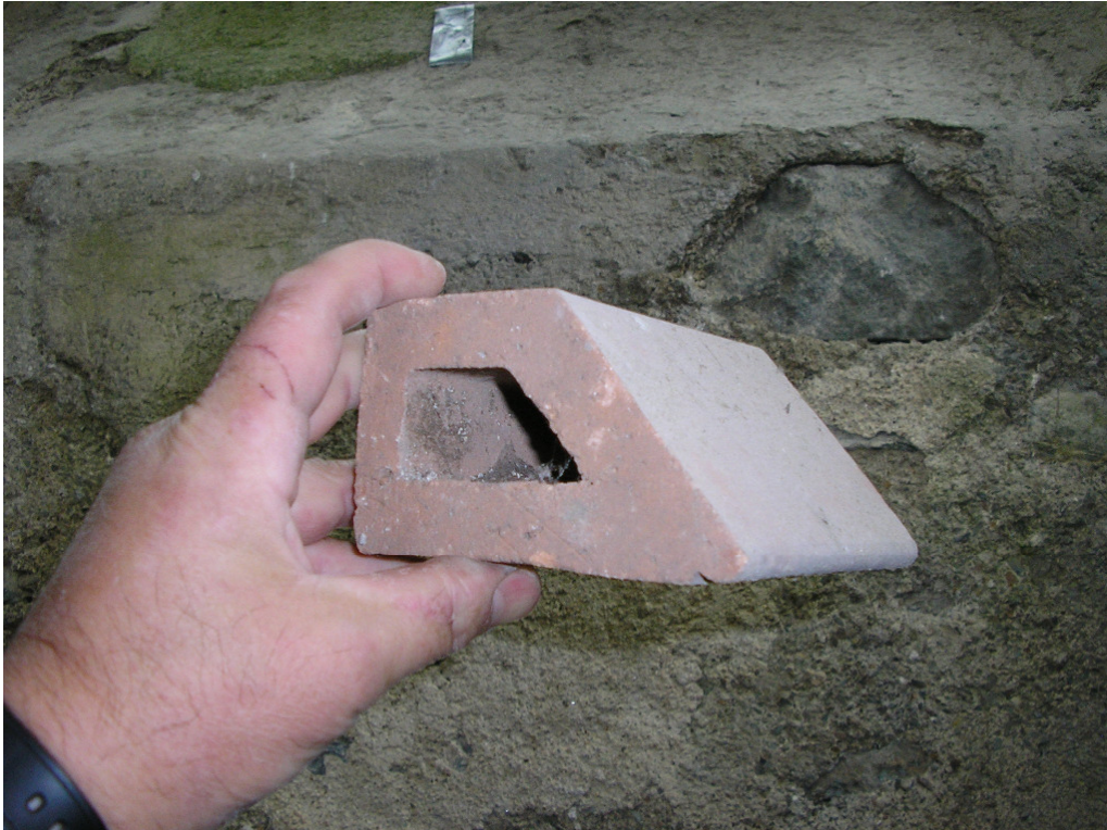
Bild 8: Formziegel Sockel, Stützfeilerabdeckung Abmessungen: Breite: 11 cm, Tiefe unten ca. 12 cm mit Wassernase/Tropfkante, Ziegelhöhe: ca. 7 cm, Wasserführung/Schräge: ca. 9 cm lang