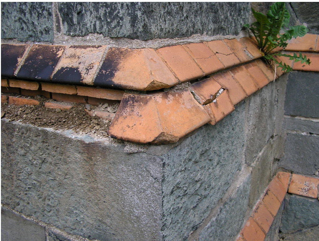
Bild 9: Formziegel Gebäudeecke, Abmessungen wie vorher beschrieben, Ansichtslängen der Schrägen: kurze Seite: ca. 11,5 auf 6,5 cm; lange Seite: ca. unten 18 cm /oben 13 cm